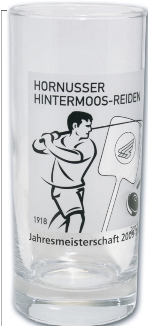
Abbildung 1 zu 1 - Höhe 141 mm / Ø 62 mm

Veredelungsoptionen mit Glossy, Ätzeisss und schwarzer Druckfarbe